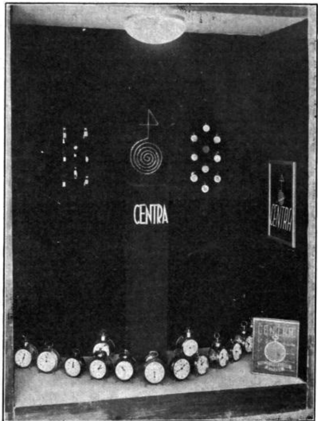
Spezialschauenster für Centra-Uhren und -Wecker. Hintergrund: schwarzer Samt, Boden grau, Säule rot. Centrazeichen aus Bandeisen, goldbronziert. Im Vordergrund ein Leuchtplakat