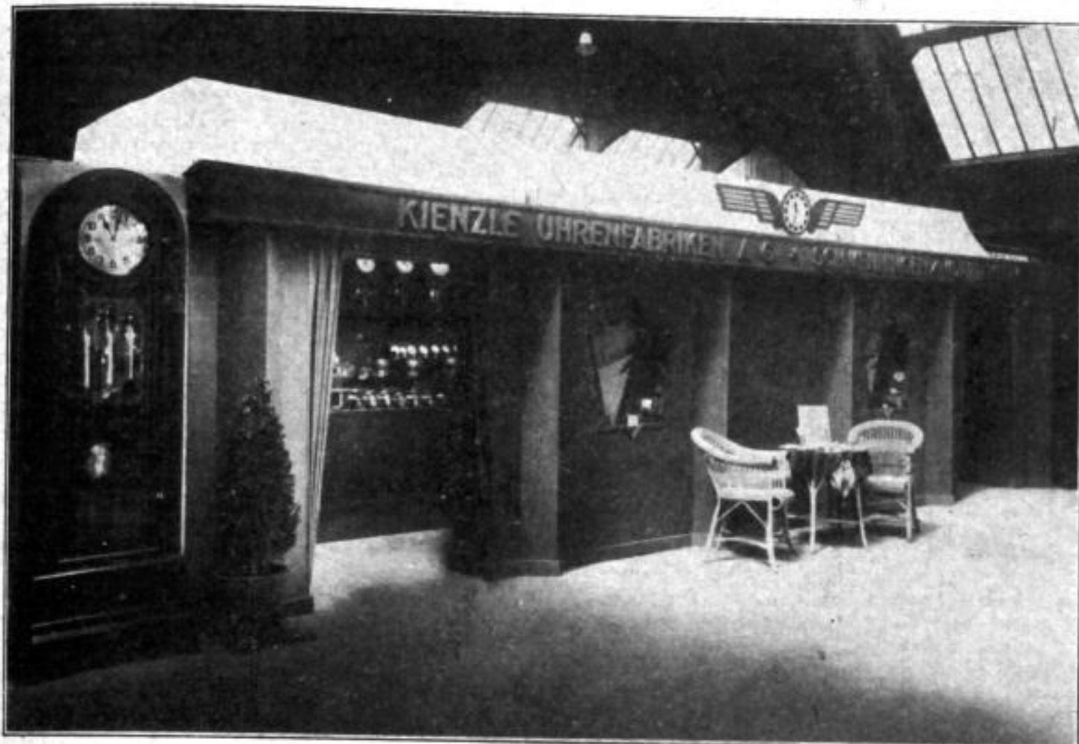
Von der Reichstagsausstellung in Köln

Stand der Kienzle-Uhrenfabriken, Schwenningen a. N. (Außenansicht), ein in den Hausfarben der Firma (blau und orange) gehaltener architektonisch äußerst reizvoller und sehr wirksamer Pavillon