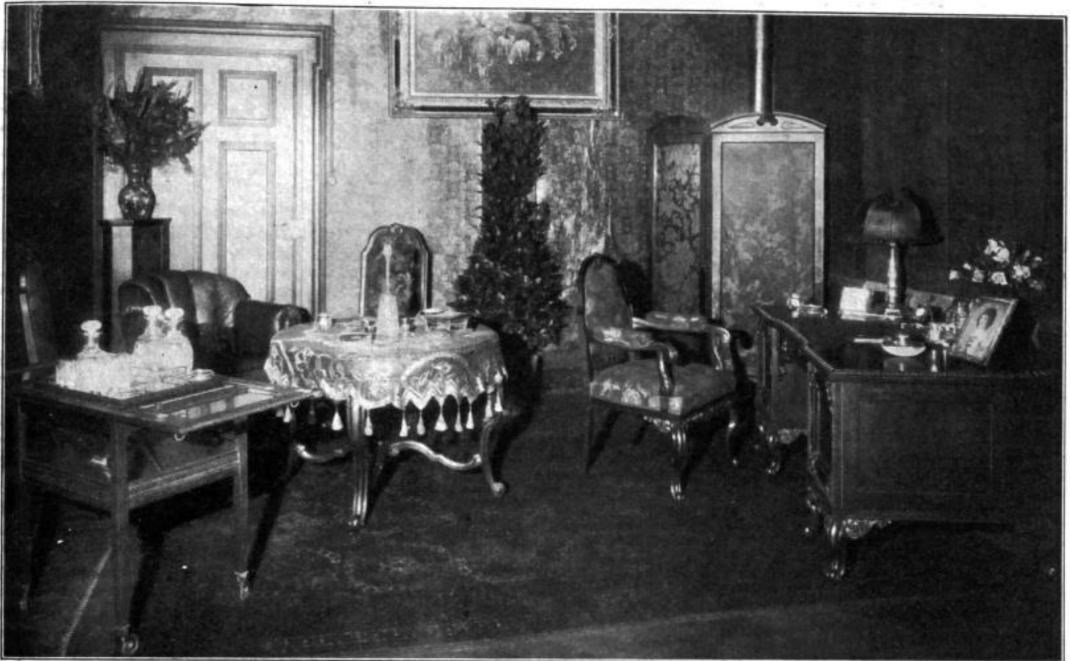
Von der Stuttgarter „Modeschau für Schmuck und Tafelgeräte“: Herrenzimmer: Silbernes Schreibtischgerät, silbernes Likörservice, Kredentzisch mit Silbergerät und Kristall