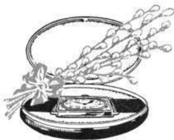
Nr. 187, Preis 2,20 Mk.