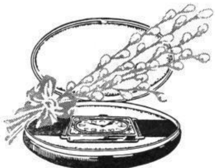
Nr. 183, Preis 3 Mk.