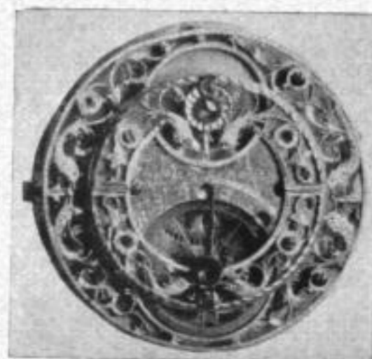
Abb. 32 Goldene Taschenuhr, bez.: „Hahn in Stuttgart“; um 1825. Kräftiger, silberner Zylinder (Lochmaß 51). In der Ornamentik der hinteren Platine Vögelköpfe und Fische. Landesgewerbemuseum Stuttgart