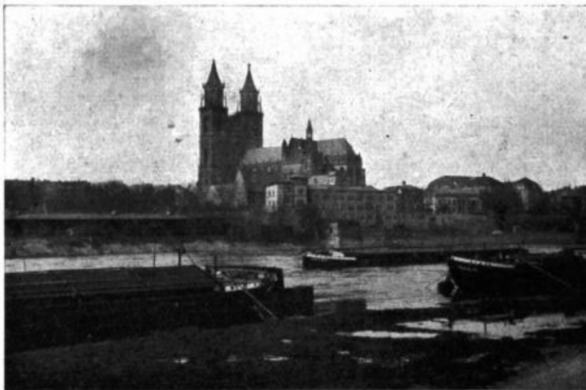
Elbansicht mit Dom

Da ist zunächst, alles überragend — bildlich und der Materie nach — das schönste Gotteshaus, das im nördlichen Deutschland, soweit die Hausteingotik in Betracht kommt, geschaffen worden ist: Der Dom. Ein Stück mittelalterlicher Größe, ein Zeuge deutscher Geschichte! Niemals zerstört, auch 1631 unbeschädigt, im Mittelalter