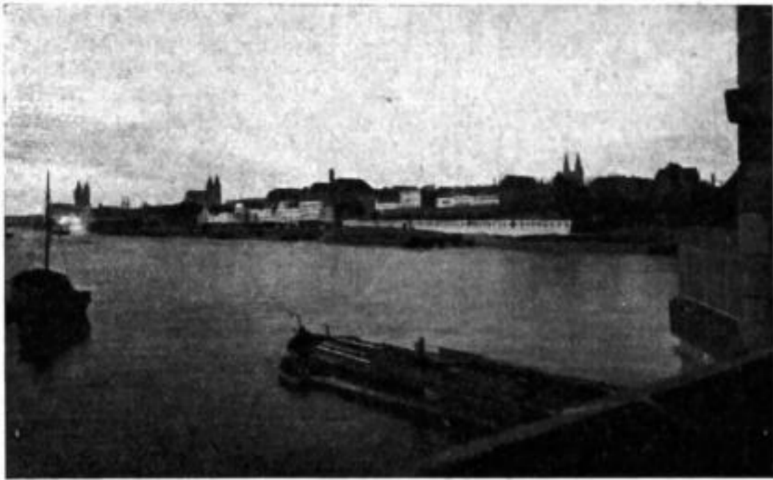
Blick von der Nordbrücke auf die Stadt Magdeburg

dürfen nur in dringenden Fällen gemacht werden. Über die Dringlichkeit entscheidet der Vorstand.