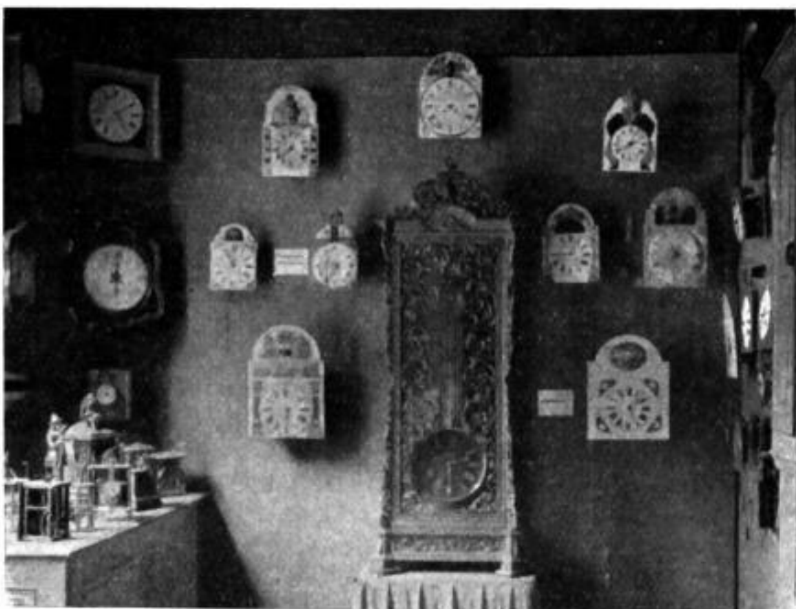
Schwarzwälder Männleuhren und Spieluhren