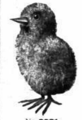
Nr. 9981 Osterkücken , 3 1/2 cm hoch, aus gelber Japanwolle, sehr wirksam Djgd. RM. 0.35

Rudolf Flume, „Das Haus des Uhrmachers“, Berlin SW 19