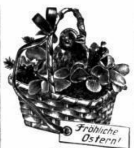
Nr. 9110 Körbchen , viereckig, Deckel mit Veilchen und gelbem Kücken, mit Karlchen „Fröhliche Ostern“, sehr niedlich, für kleine Geschenkartikel Stück RM. 0.60