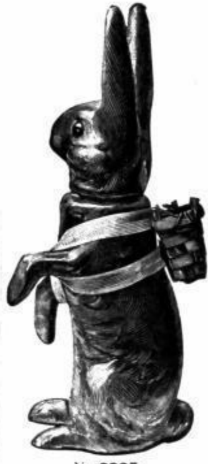
Nr. 9905 Goldhase , sehr hübsch ausgeführt, ganz Goldbronze überzogen, 20 cm hoch Stück RM. 0.50