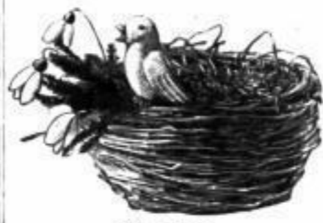
Nr. 9983 Körbchen , sehr hübscher Dekorationsartikel, 10 cm Durchmesser. . . . . Stück RM. 0.55