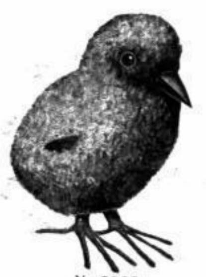
Nr. 9982 Osterkücken , 5 cm hoch, aus gelber Japanwolle, sehr wirkungsvoll. . . . . Djgd. RM. 0.60

Nr. 9906. Einseitige plastische Goldhäschen , laufend, 6 cm lang, wie in obiger Dekoration Djgd. Paar RM. 0.75