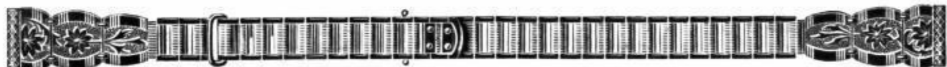
Nr. 21062. Am. Doublé mit gebogenem und geradem Scharnier, 10 mm breit . . . . . Stück Mk. D.ou