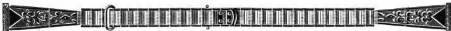
Nr. 21061. Am. Doublé mit gebogenem und geradem Scharnier, 8 mm breit . . . . . Stück Mk. D.uu