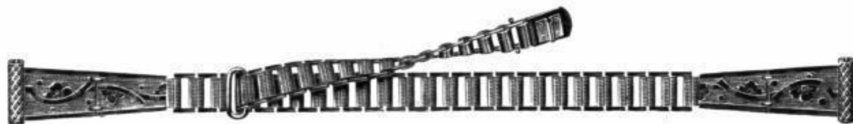
Nr. 4001. Ia. Amerik. Doublé . . RM. D.uw

Jedes Muster ist auch mit gebogenem Scharnier am Lager