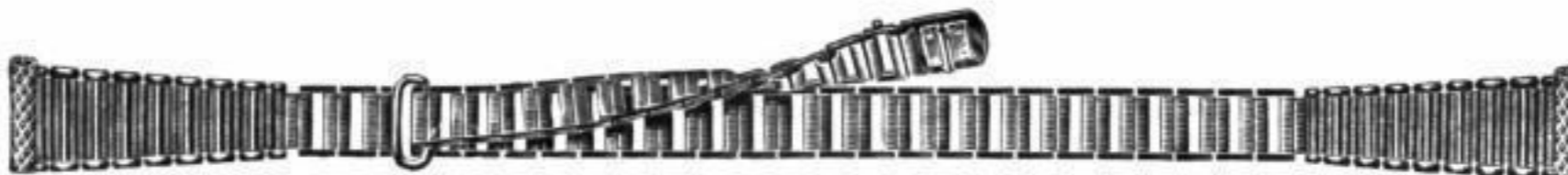
Nr. 4003. Ia. Amerik. Doublé . . RM. U.rs

Jedes Muster ist auch mit gebogenem Scharnier am Lager