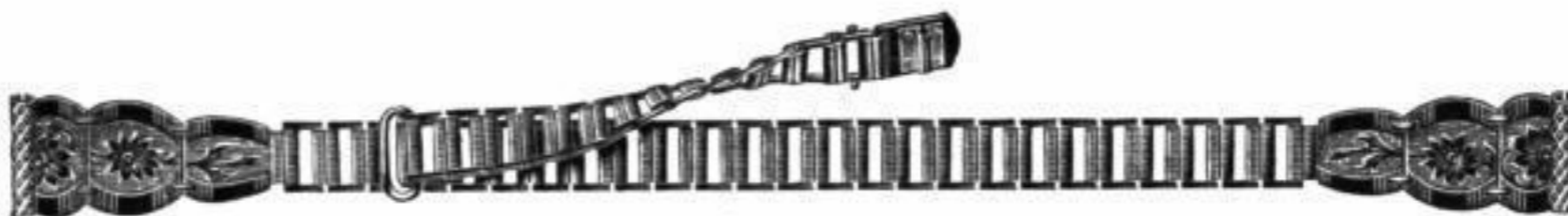
Nr. 4002. Ia. Amerik. Doublé . . RM. D.ou