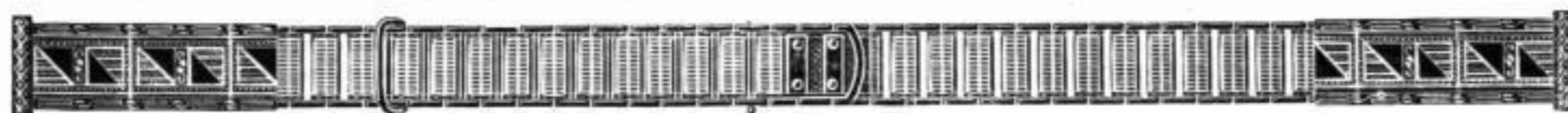
Nr. 21063 Am. Doublé, mit gebogenem und geradem Scharnier, 8 mm breit, am Ende gemessen . . . . Stück Mk. U.is