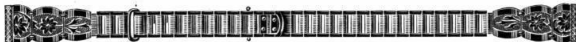
Nr. 21062 Am. Doublé, mit gebogenem und geradem Scharnier, 10 mm breit, am Ende gemessen . . . . Stück Mk. D.ou