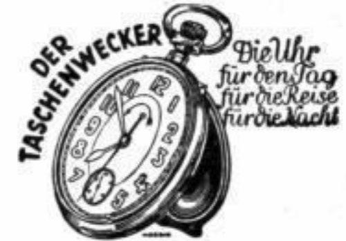
Bestellnummer 195 Preis 2,20 RM.