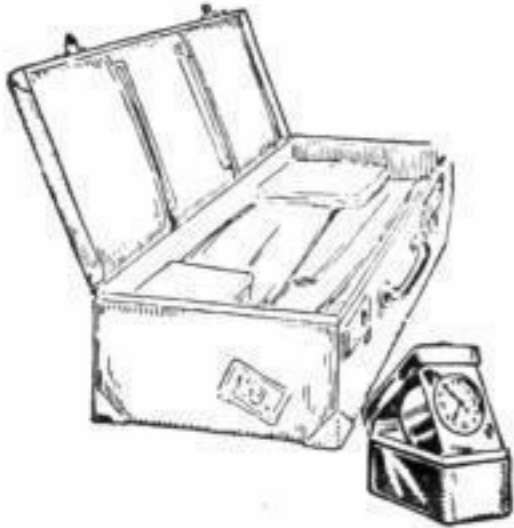
Bestellnummer 144 Preis 2,20 RM.