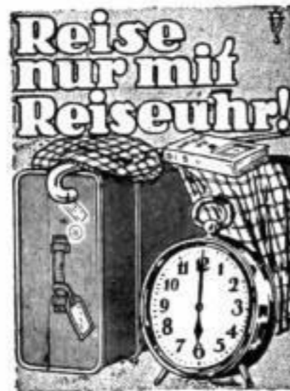
Bestellnummer 170 Preis 2,20 RM.