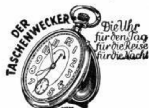
Bestellnummer 195 Preis 2,20 RM.