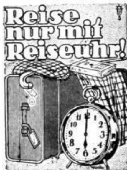
Bestellnummer 170 Preis 2,20 RM.

Blickfangende Klischees und wirksame Anzeigentexte liefert Ihnen der Zentralverband der Deutschen Uhrmacher, Halle (S.), Königstr. 84