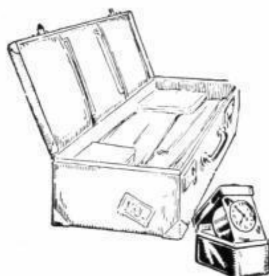
Bestellnummer 144 Preis 2,20 RM.