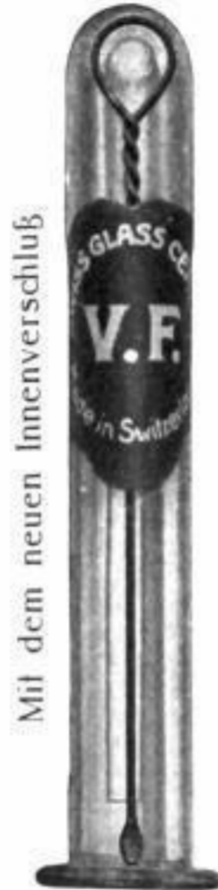
Mit dem neuen Innerverschluß

Hersteller: Fabrique suisse de Verres de Montres S. A. Fleurier, Schweiz