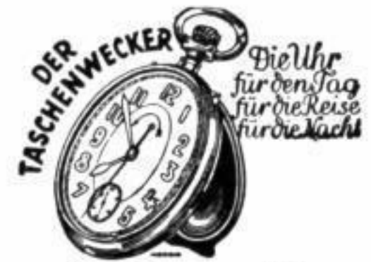
Bestellnummer 195 Preis 2,20 RM.