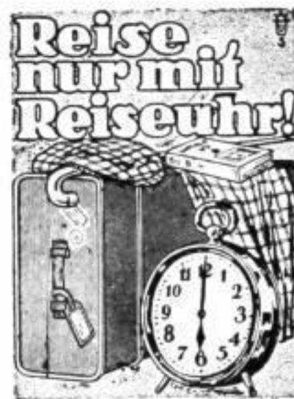
Bestellnummer 170 Preis 2,20 RM.