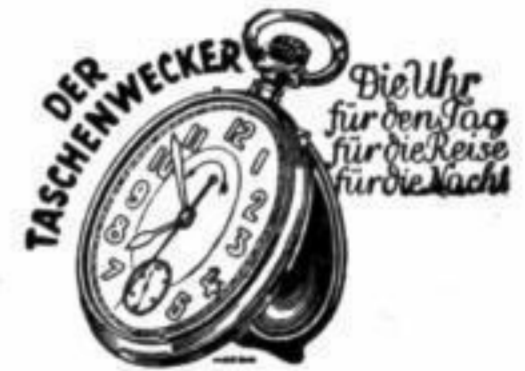
Bestellnummer 195 Preis 2,20 RM.