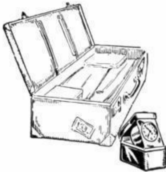
Bestellnummer 144 Preis 2,20 RM.