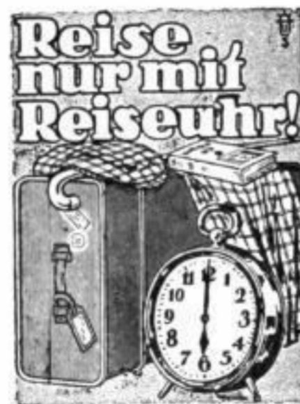
Bestellnummer 170 Preis 2,20 RM.