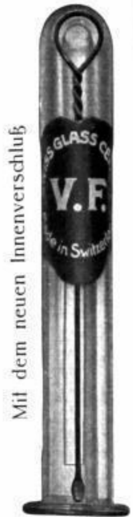
Mit dem neuen Innenverschluss

Hersteller: Fabrique suisse de Verres de Montres S. A. Fleurier, Schweiz