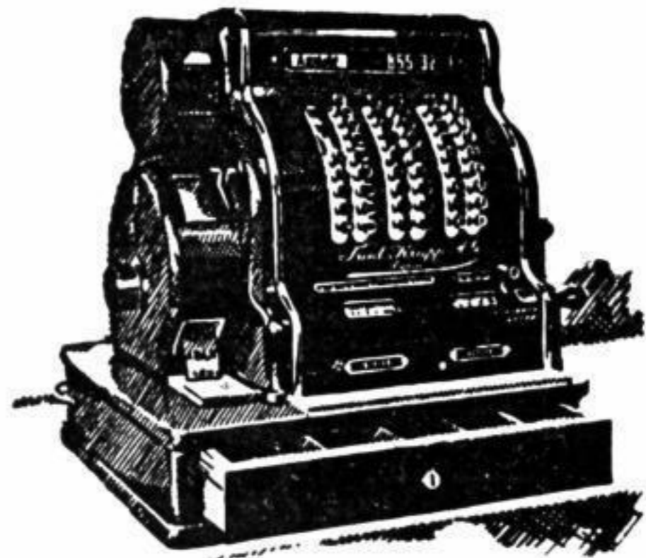
Die Kontroll-Kasse für Sie!