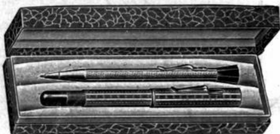
Nr. 19302. Garnitur Silber 800, Füllhalter mit 14 kar. Goldfeder und Drehbleistift in Etui . . . . . RM. J,os