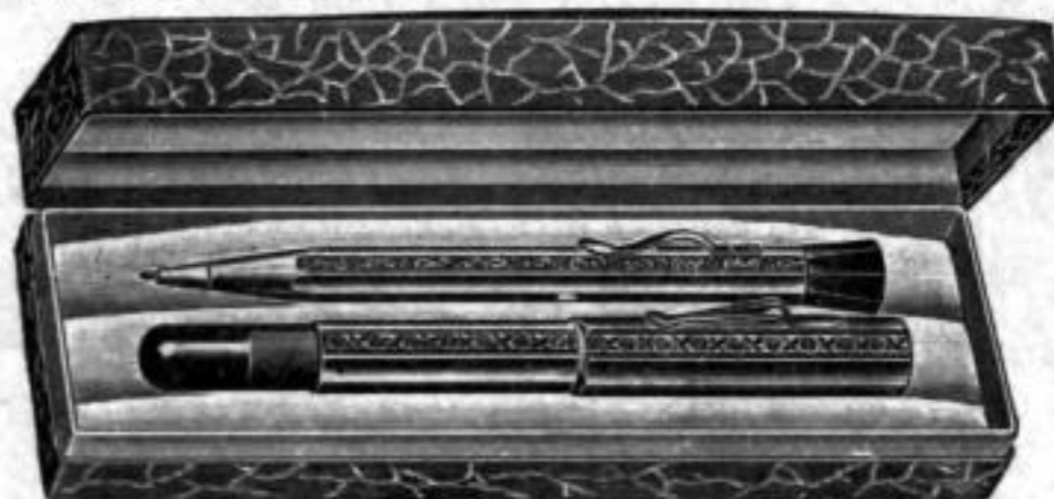
Nr. 19303. Garnitur Silber 800, Füllhalter mit 14 kar. Goldfeder und Drehbleistift in Etui . . . . . RM. N,as