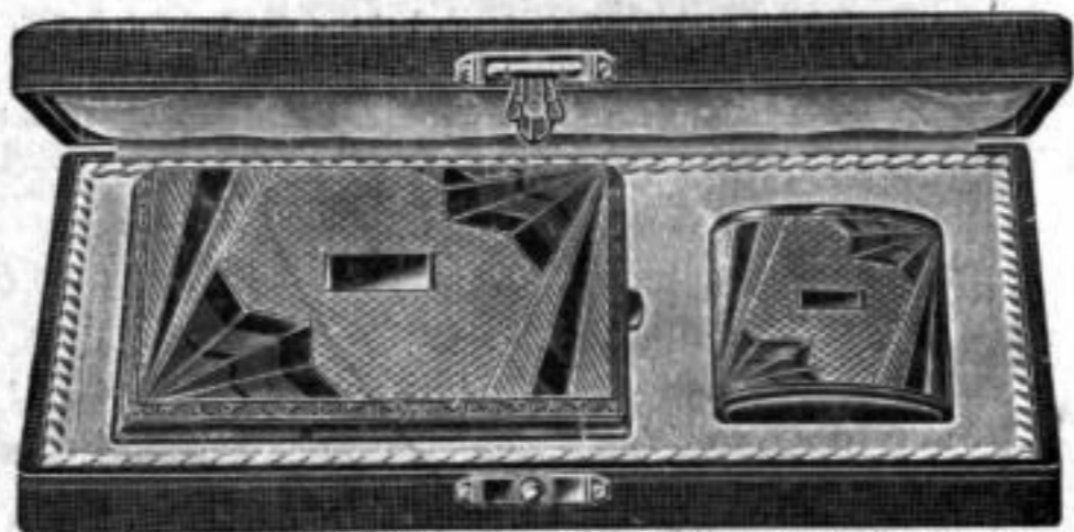
Nr. 16000. Garnitur Ia Alpaka, Zigaretten-Etui Nr. 1405 und Streichholzdose Nr. 702 in elegantem Etui . . . . . RM. R,uw