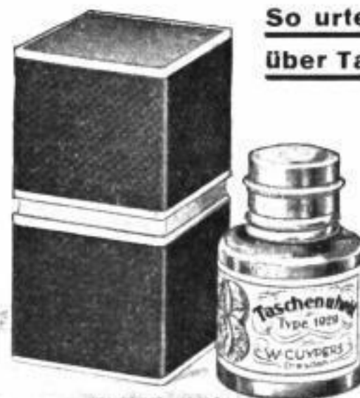
Originalflasche RM B,du

So urteilt die Kollegenschaft über Taschenuhröl Type 1929