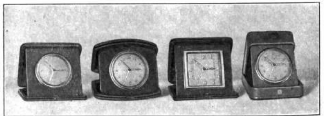
2103 M. 10,5×10,5 cm, Saffian braun oder weinrot . . . . . BB,bu 7312 K. 10,5×10,5 . . . . . BB,ds 7087 K. Saffian blau oder weinrot . . . . . BU,as 2106 M. 10,5m×10,5 cm, Saffian braun, Lunette verchromt . . . . . BB,os 7309 K. Lunette vergoldet . . . . . BO,- 7313 K. 10×8,5 cm, Rindleder braun oder hell . . . . . BA,lu

in vornehmem Lederetui mit flachem, massivem 1-Tag-Weckerwerk, Fabrikat Maulhe oder Kienzle, vergoldetem Metallzifferblatt, Radiumzahlen und -Zeigern