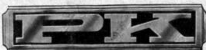
Längliche Form Nr. 102 Versilbert Nr. 202 Vergoldet