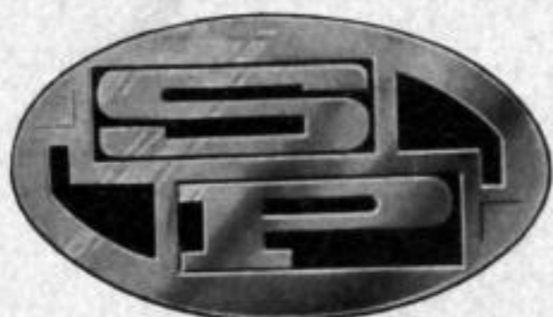
Ovale Form Nr. 101 Versilbert Nr. 201 Vergoldet

Das Monogramm macht die Brosche zum Schlager!