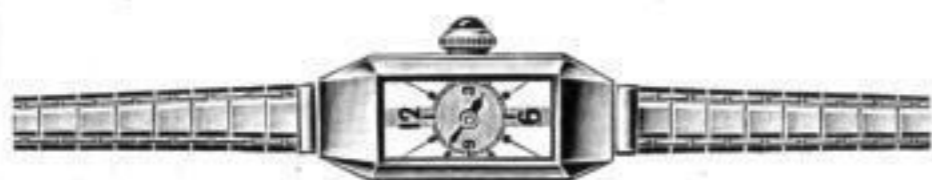
Armbanduhren aller Art

„DEFINITIV“ KONTROLL-BUCHHALTUNG GMBH, BERLIN-WEISSENSEE SEDANSTR. 46