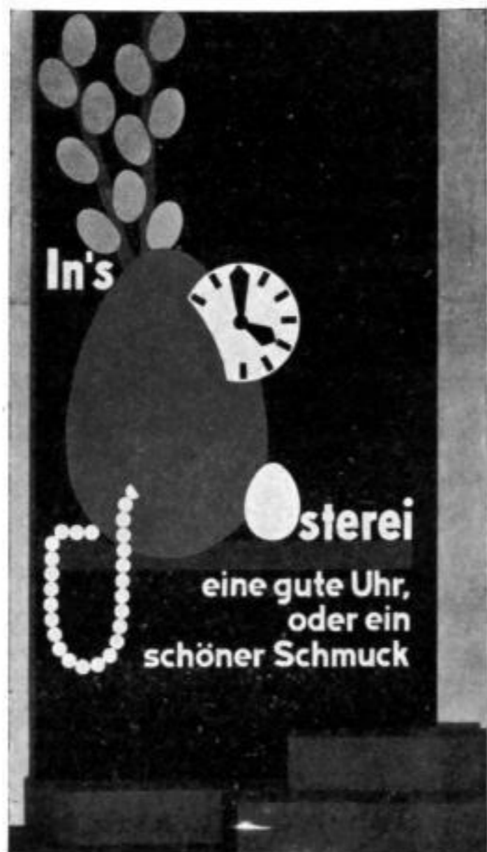
Farben des Blickfanges: Unterggrund: dunkelblau; Osterie: hellblau; Querbalken: rot; Zifferblatt, Kette und Schrift: weiß; Weidenkätzchen: silber; Stiele: braun.

kätzchen: silbern, Stiele: braun, Zifferblatt: gelb, Schrift: weiß.