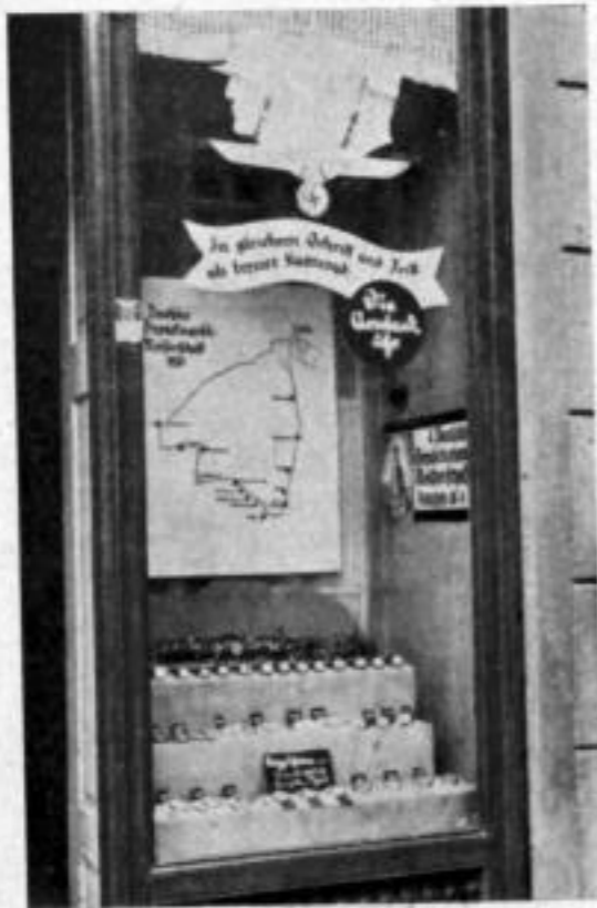
Der Gepäckmarsch wirbt für Uhren

Wenn Sie ein Ereignis ausnutzen wollen, dann geht es meist immer. Oder wären Sie — so ganz beiläufig — wohl darauf gekommen, daß man einen Reichsgepäckmarsch, der zufällig in Ihrer Gegend abgehalten wird, als Anlaß nehmen könnte, für eine schöne Uhren-Ausstellung? Uhrmachermeister E. Scholze in Baußen hat das in sehr geschickter Weise getan. Von seinem Fenster vermitteln Ihnen unsere beiden Bilder einen guten Eindruck. Die Bilder sprechen für sich. Kleine Soldaten — Spielzeugfiguren — haben ihre Startnummern bekommen und marschieren stramm vor der umfangreichen Stadtansicht vorbei. Gleich vor den Soldaten liegen in mehreren Stufen Armbanduhren in allen Preislagen.