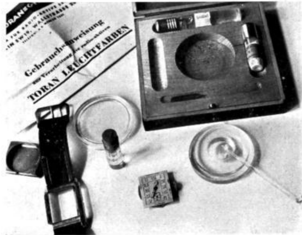
Damit wird die Leuchtmasse aufgelagert

In diesem Hause finden Sie auch das Laboratorium der Toran-Gesellschaft, eine der bekanntesten Lieferfirmen der Leuchtmasse. – Für den Uhrmacher sind die handlichen Kästen mit allem Zubehör sehr wichtig, denn immer mehr werden gerade Armbanduhren mit Leuchtzahlen versehen.