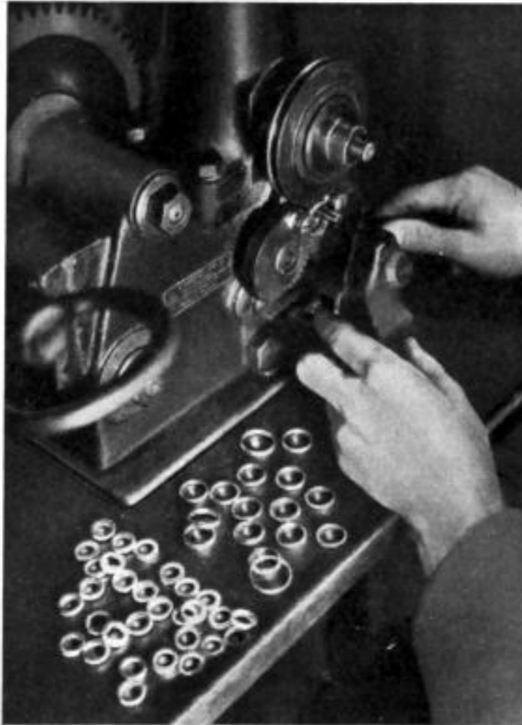
Die Randelmaschine formt die Trauringe

Die Firma Truxa & Co., ebenfalls im „Spindlers Hof“, im gleichen Haus wie Flume, besitzt einen gut eingerichteten Betrieb für die Herstellung von Trauringen aller Art. Es ist immer wieder interessant, den Werdegang eines Trauringes vom Legieren an zu verfolgen. Es ist ein arbeitsreicher Weg, und erst aus der Randelmaschine kommen die Rohlinge fast fertig heraus.