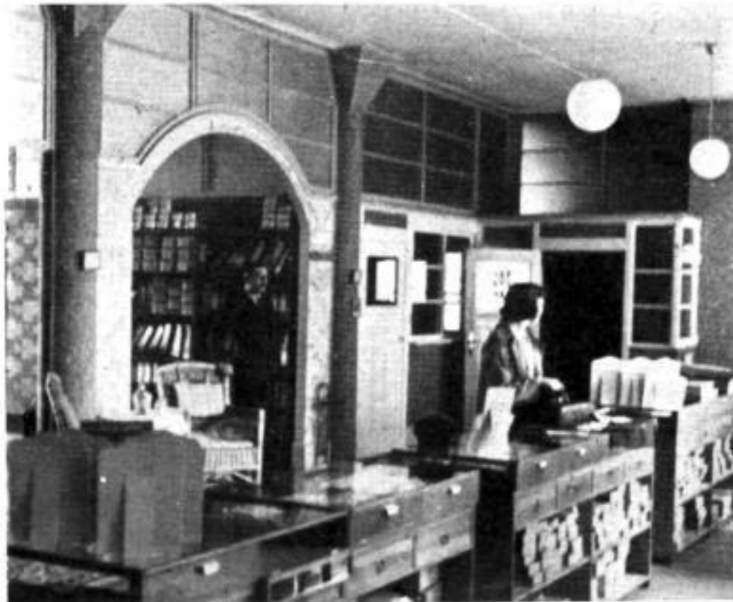
Gebr. Born im „Spindlers Hof“ Foto: Uhrmacherkunst

Gebrüder Born ist eine angesehene Großhandlung für Bernsteinwaren, Elfenbein, Edelstein und für gangbaren Schmuck. Sie finden diese Firma, deren Kunden hauptsächlich Uhrmacher sind, Wallstraße 11/12, also auch im „Spindlers Hof“.