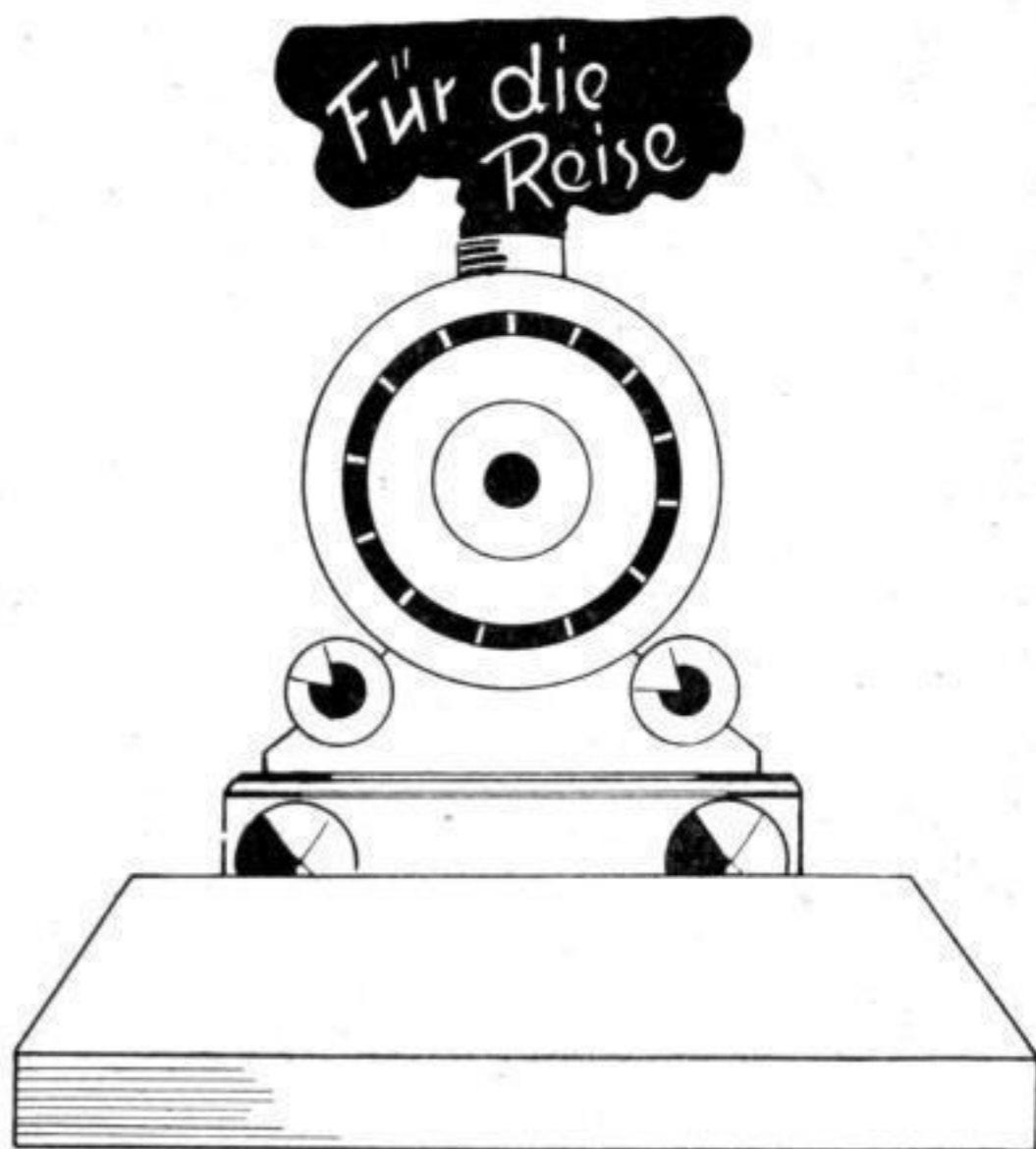
Darauf müssen Sie hinweisen: „Was fehlt zum Reisen?“

Wer allerdings die nötige Zeit aufbringen kann und auch viel Liebe hierfür besitzt, kann sich selbst sogar auf einfache Art einen sehr netten und sogar originellen Blickfang herstellen.