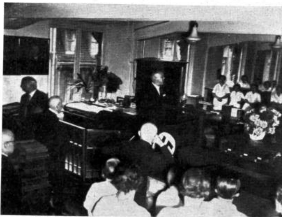
Reichsinnungsmeister Flügel bei seiner Ansprache