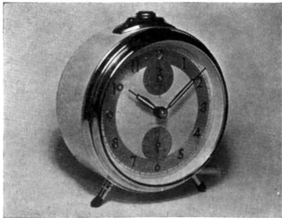
... für das Auge des Kunden