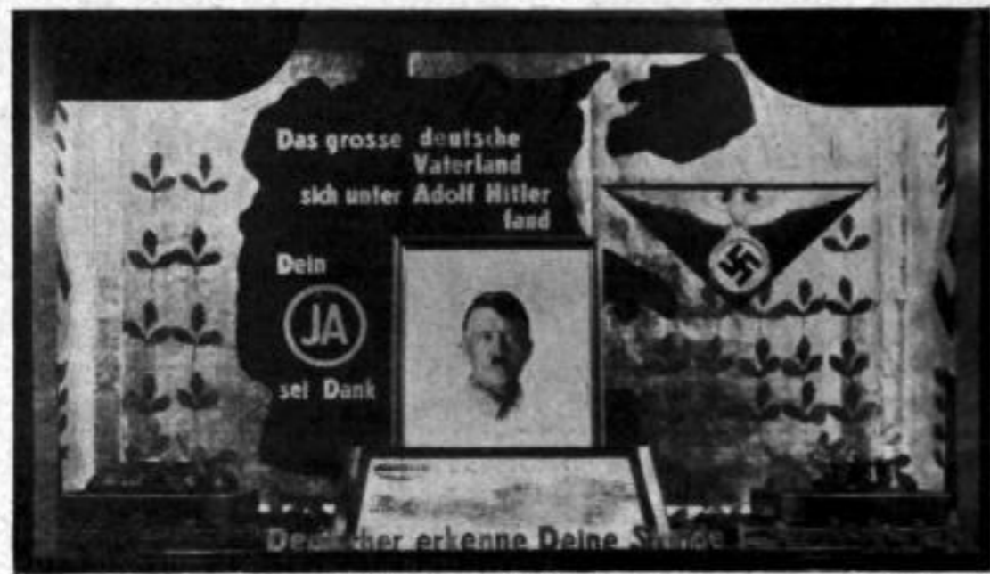
Ein vorbildliches Wahlschaufenster

Die Ausstellung wird gemeinsam mit dem Badischen Landesgewerbeamt in dessen Ausstellungshallen in Karlsruhe, Karl-Friedrich-Straße 17, durchgeführt. Sie begann am 13. April mit einem Festakt, bei dem Ministerpräsident Köhler sprach. (VI 1/8719)