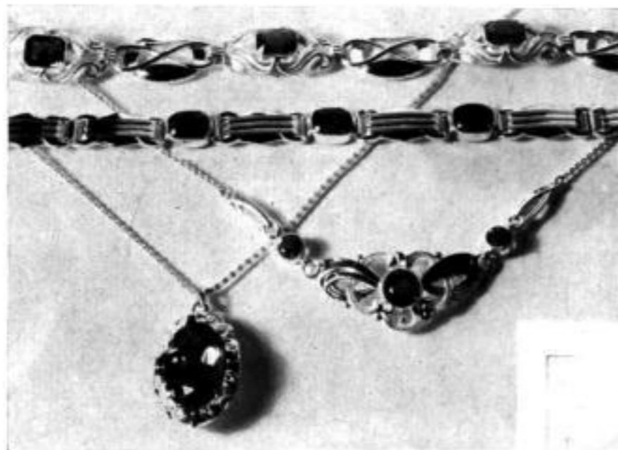
Sämtliche Aufnahmen: Uhrmacherkunst