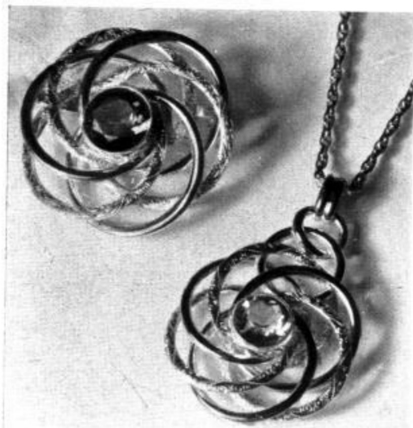
Knoten — in immer wieder schönen Anordnungen!