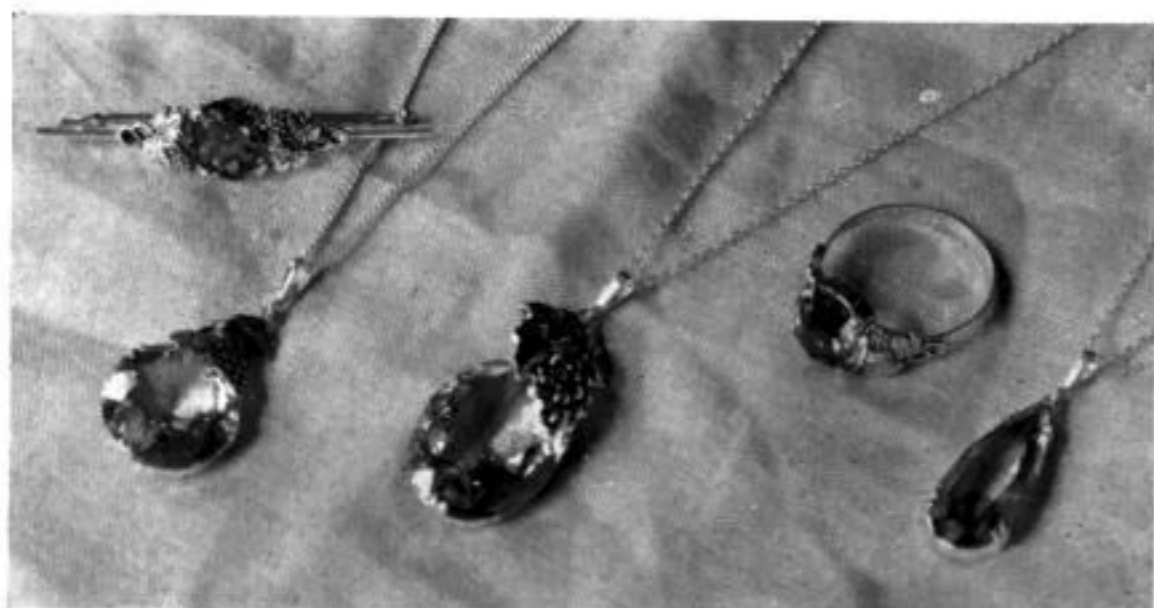
Rheinkiesel-Schmuck — für viele Fremdenorte ob seines hübschen Aussehens ein guter Verkaufsartikel!