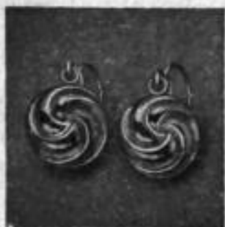
Nr. 74901 RM A,-

Preise für amerik. Dublee mit 50/000-Bügel