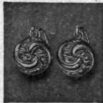
Nr. 74902 RM A,-