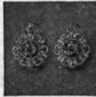
Nr. 74900 m. imit. Saphir RM A,lu