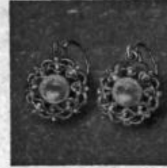
Nr. 74905 mit Perle RM A,uw Nr. 74904 mit imit. Rubin RM A,uw