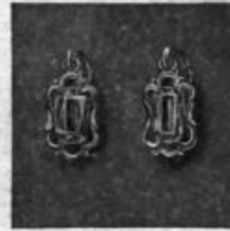
Nr. 74903 mit imit. Aqua RM A,bu Nr. 74907 mit imit. Rubin RM A,bu