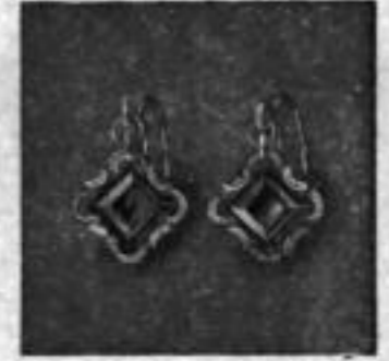
Nr. 74906 mit imit. Rubin RM A,su

Die Brisuren dieser Ohrringe stellen eine neue Ausführung der Patentbrisur dar. Das Vorderteil der Brisur ist eine langgestreckte Oese, die am Ohrläppchen anliegt und dem Ohrring den Halt gibt. Am oberen Teil dieser Oese ist eine runde Oese zur Aufnahme des beweglichen Teiles des Ohrringes angebracht, während die Unterseite der Oese den Brisurenfuß trägt. Die Spitze der Klappmechanik geht in die Form des Bügels über; dadurch wird das Hängenbleiben in der Spitze der Klappe vermieden.