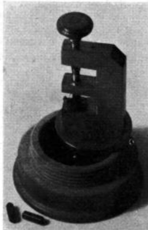
Aufnahme: Uhrmacherkunst Der Apparat zum Verengern der Spiralrolle

„Allerdings, sie arbeitet ganz genau so! Auf dem runden Sockel F ist der Körper K aufgebaut, dessen Form aus dem Photo hervorgeht. Durch die große Bohrung kann unten und in der Mitte je ein Einsatz eingesteckt werden, die durch die Schraubenspindel S zusammengepreßt werden.“