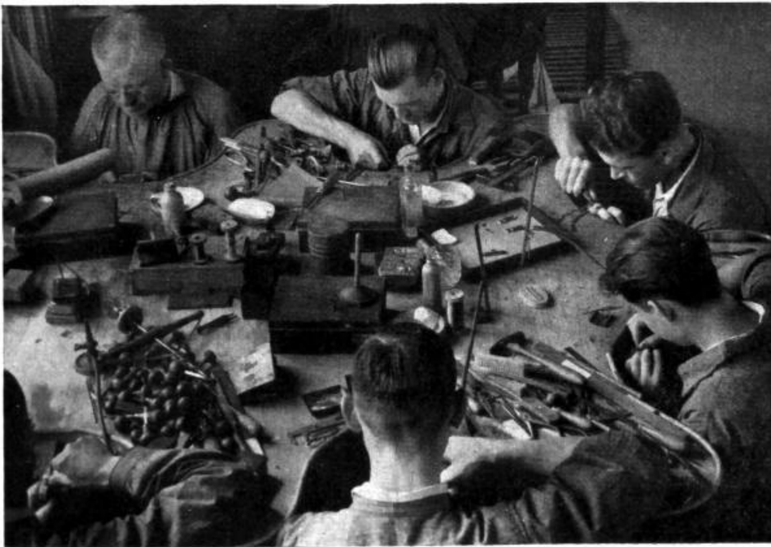
Aufnahmen: Balj 1 Archiv Uhrmacherkunst 2