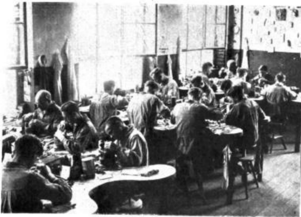
Die Stahlgraveure fertigen die Gesenke