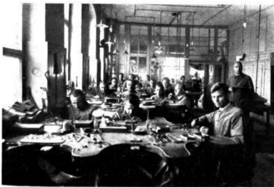
Zusammenbau der Uhrengehäuse