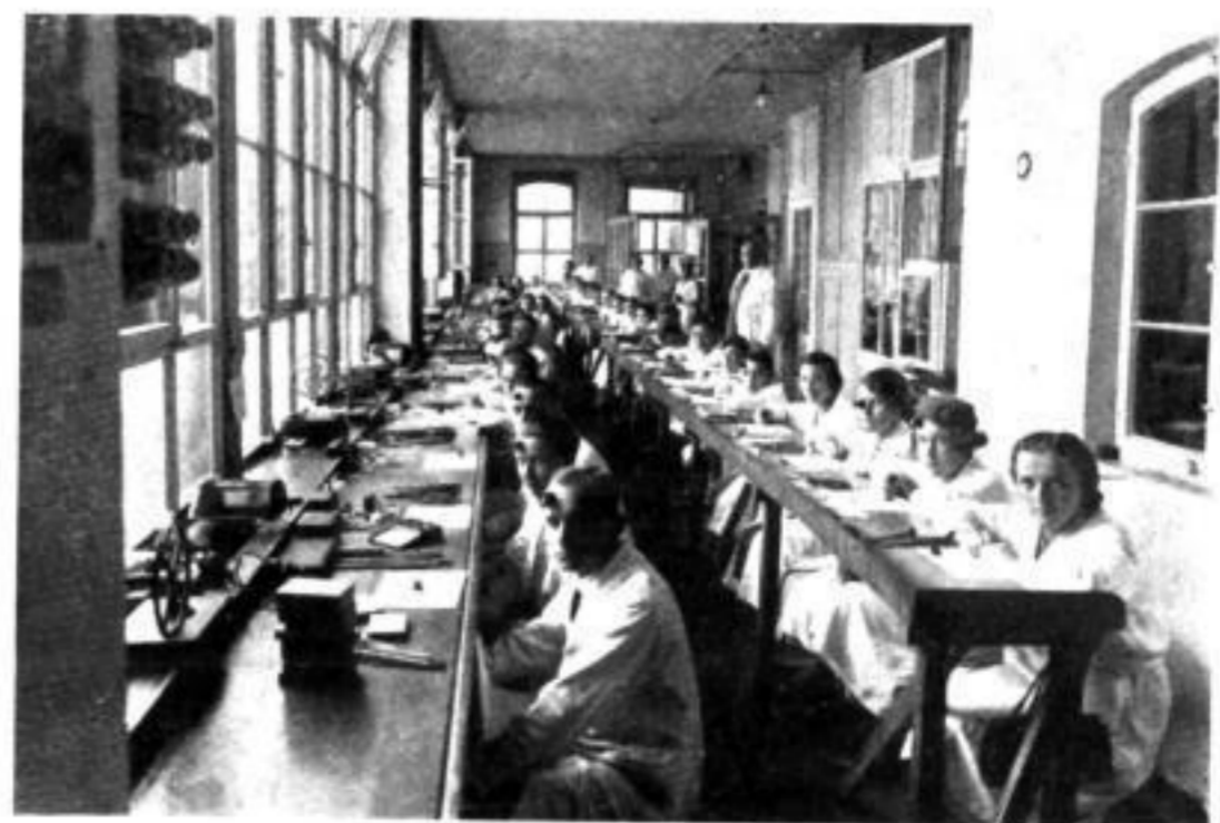
Remontage-Abteilung einer Uhrenfabrik