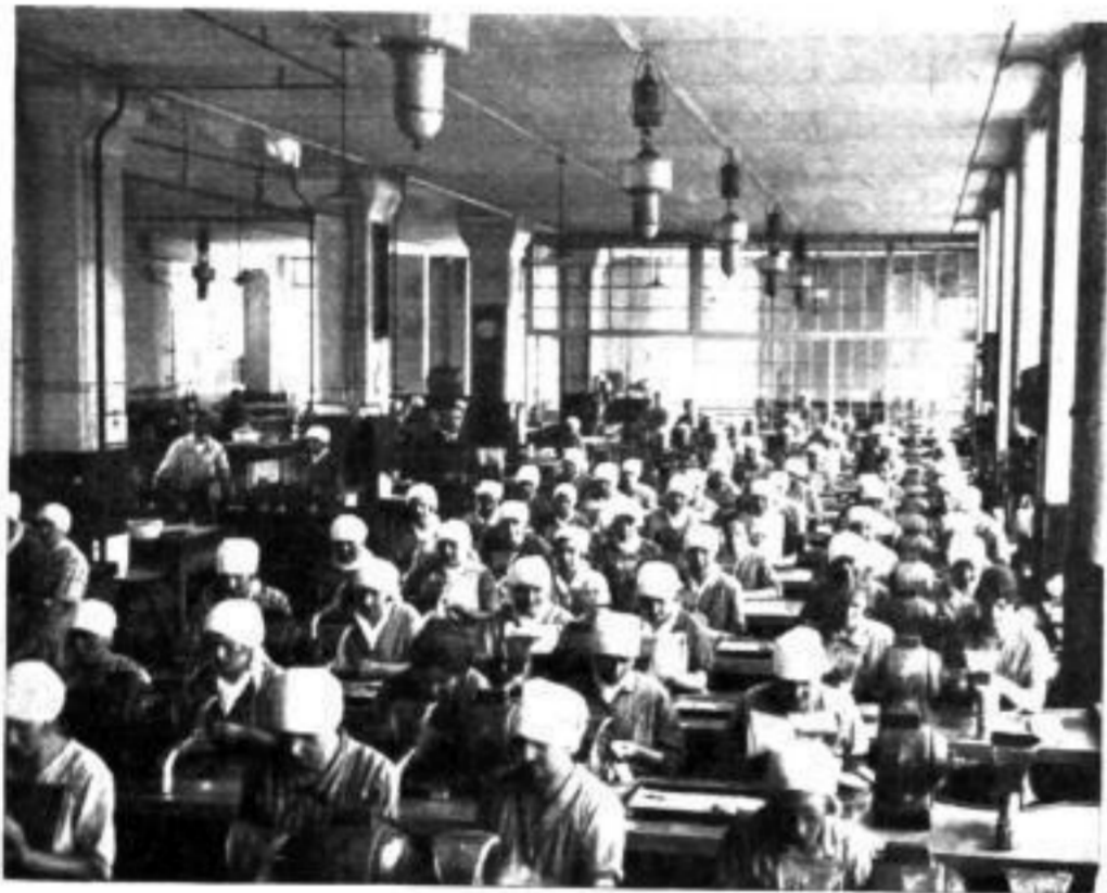
Fleißige Polisseusen verleihen dem Schmuck den letzten Glanz