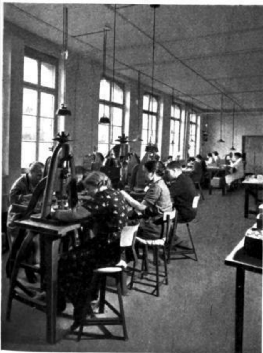
Die Bandteile und Zubehörteile werden gestanzt und geprägt. Diese Aufnahme vermittelt deutlich den Eindruck heller, sauberer Fabrikräume