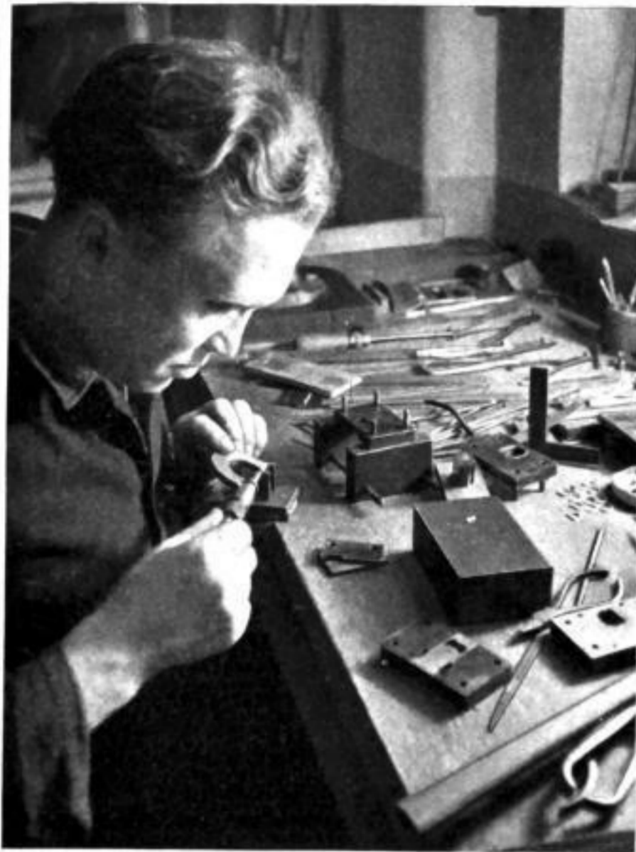
In der feinmechanischen Werkstatt werden die Schnitte, Stanzen und Prägwerkzeuge für sämtliche Zubehörteile hergestellt. Peinlichste Genauigkeit ist Grundbedingung