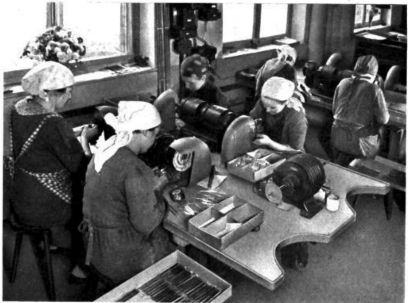
Die Metall-Uhrarmbänder und die Beschläge werden poliert