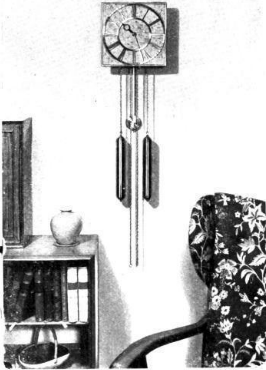
26 x 26 cm

wie sie zu „Deutschen Möbeln“ passend gewünscht und immer öfter vom Publikum gekauft werden.