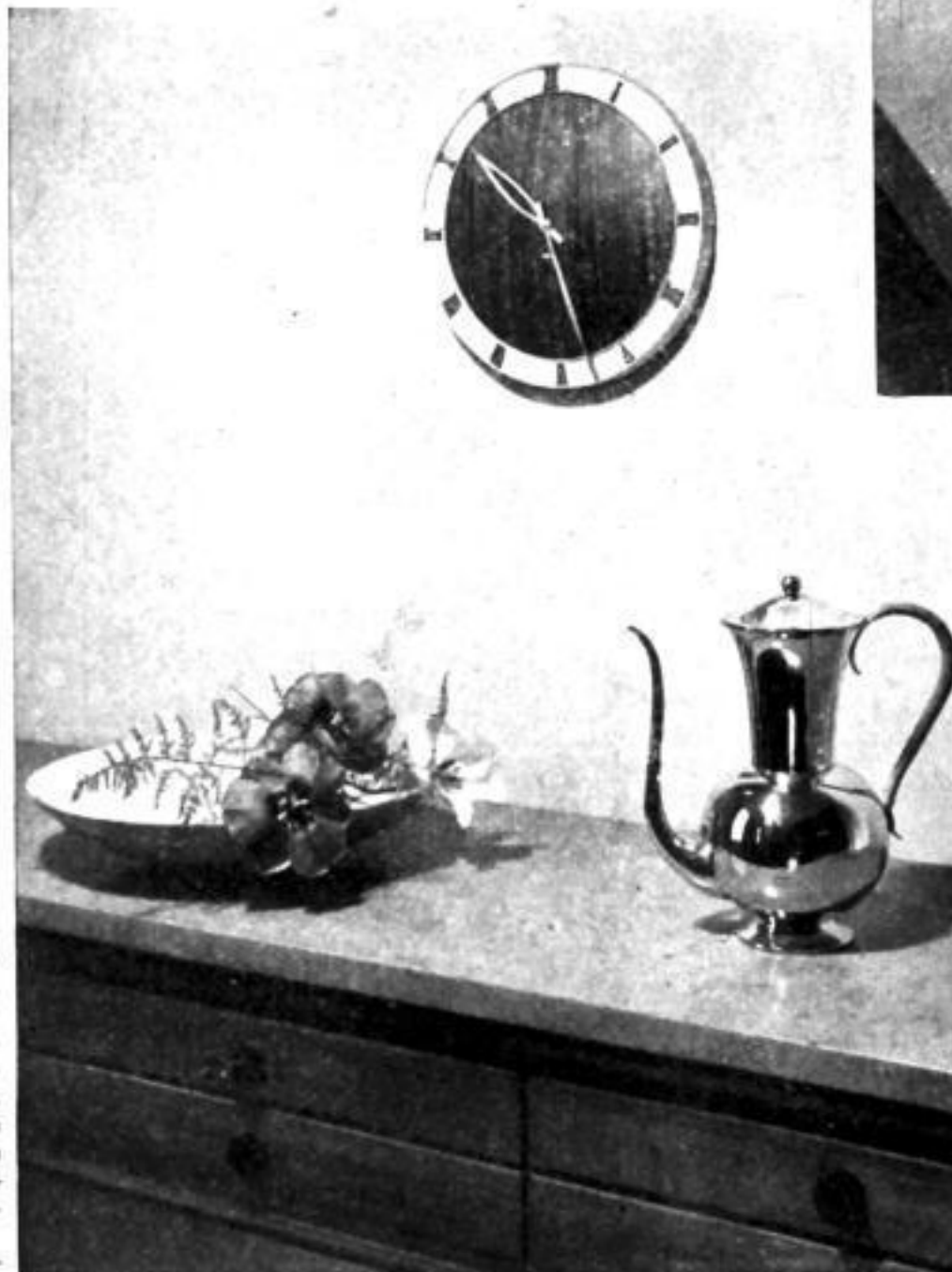
29,5 cm Ø

Nr. 13/7 M Stiluhr JUNGHANS MEISTER. Große Form in zurückhaltender Eleganz. Zifferblattgrund echt Kalbspergament. Rahmen, Sockelkanten, aufgelegte Zahlen und Zeiger vergoldet. Blattmitte, Zahlenring und Sockelprofil brüniert. Sehr ganggenaues 8 Tag Ankergehwerk mit 14 Steinen. Ladenpreis ..... RM. 125.—