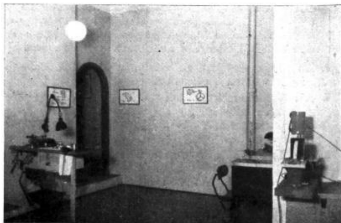
Bequeme Arbeitsplätze, Sauberkeit und Ordnung erleichtern die Arbeit