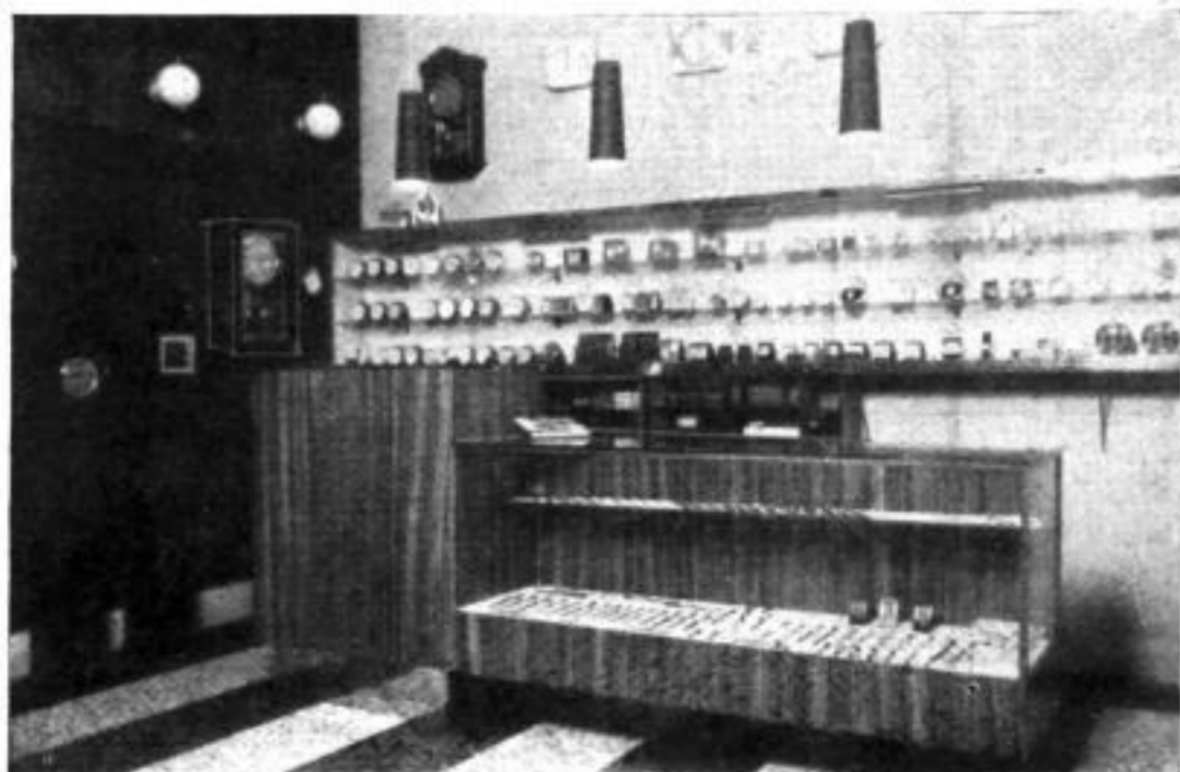
Interessant sind die Lampen und der durchgehende Warenschrank an der Rückwand