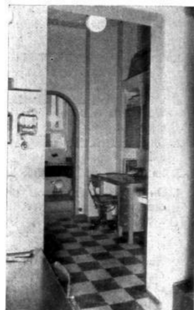
Der Durchgang zwischen Werkstatt und Laden dient als Schreibecke