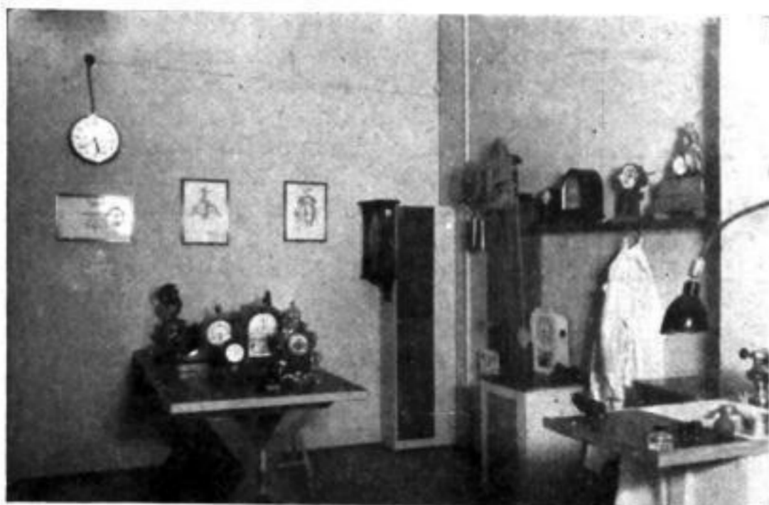
Hell und freundlich ist die Werkstatt, an der Wand hängen Fachzeichnungen