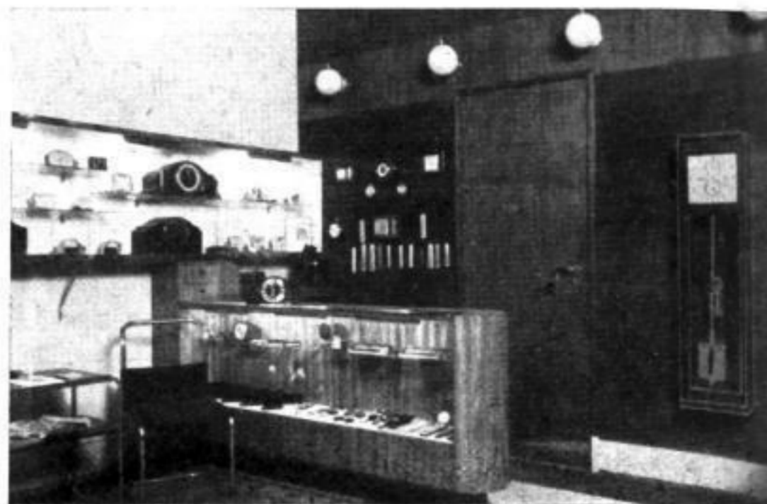
Eine Wartecke und die Pendeluhr fehlen nicht