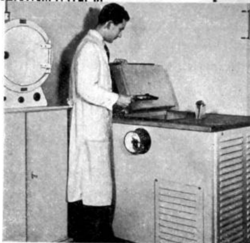
Für die Feinstellung der Präzisionsuhren in den verschiedenen Temperaturen ist ein Wärmeschrank (links) und eine Kältefrüh vorhanden.