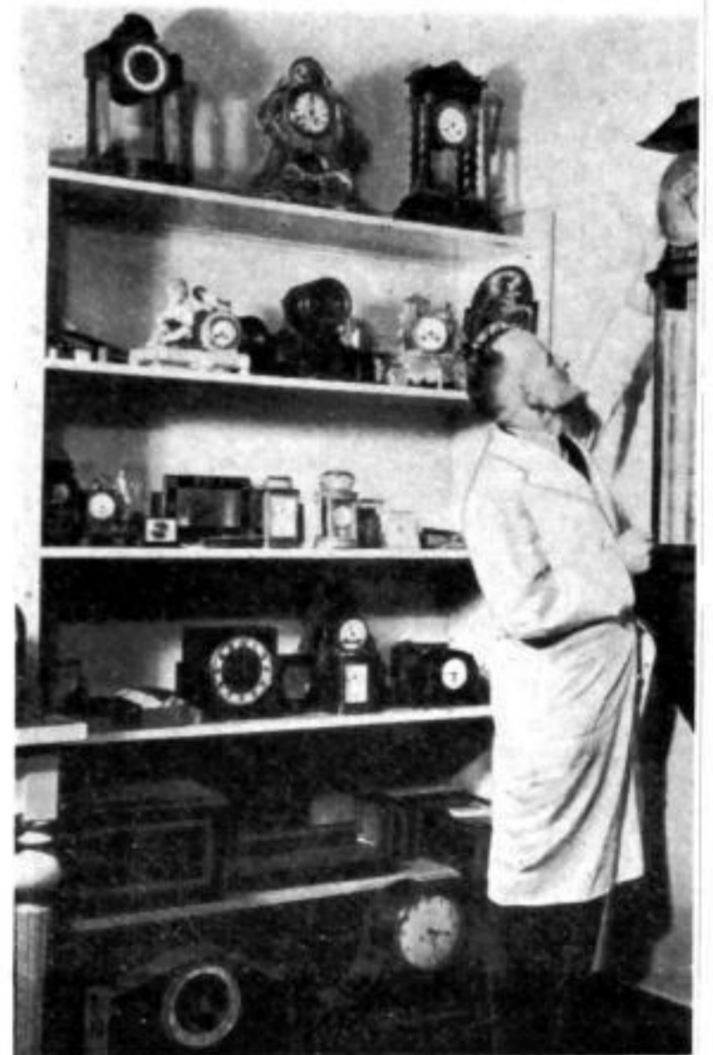
Die Werkstatt des Großuhrmechers birgt stets zahlreiche Prunkstücke.