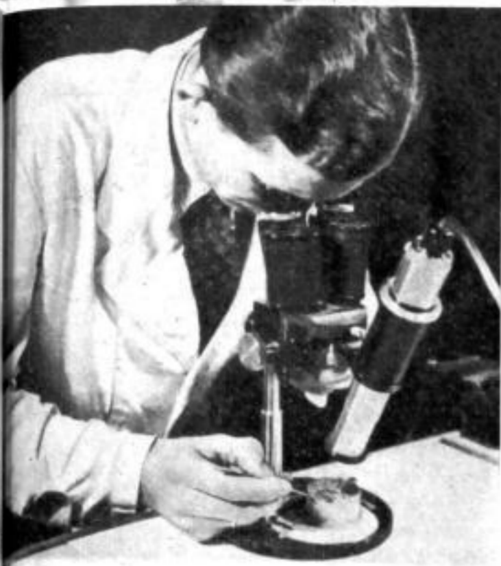
Das binokulare Mikroskop ermöglicht plastisches Sehen; es wird darum in Zweifelsfällen oft benutzt.