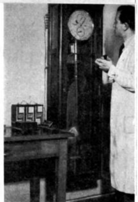
Zur Feinstellung gehört selbstverständlich eine Präzisions-Pendeluhr.