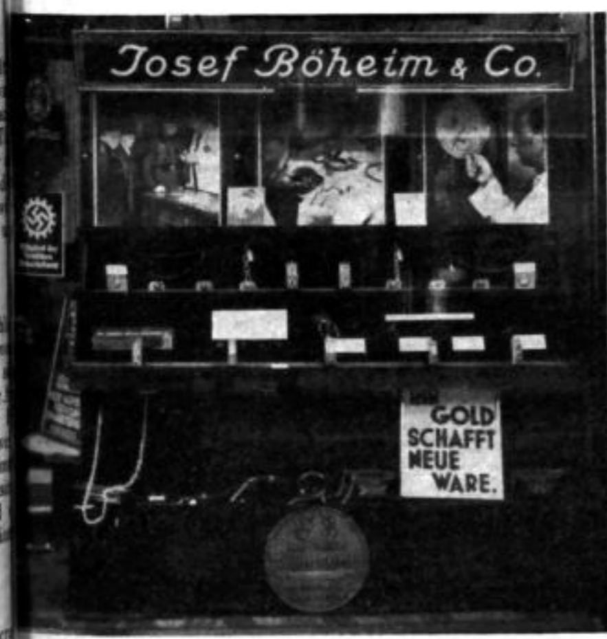
Im Schaufenster wirbt der „Schaufensterdienst“ des RIV.