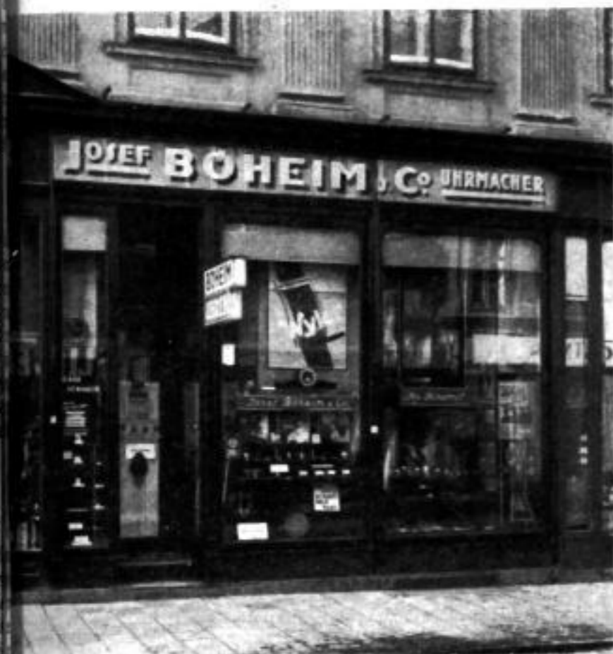
Das Geschäft des Obermeisters Böheim