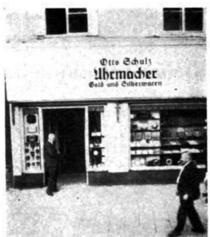
... und jetzt: Schulz in Linz

3 Aufn.: Alois Schwarz, Linz a. d. D. 1 Aufn.: F. J. Weidinger, Linz a. d. D. 2 Aufn.: Privat