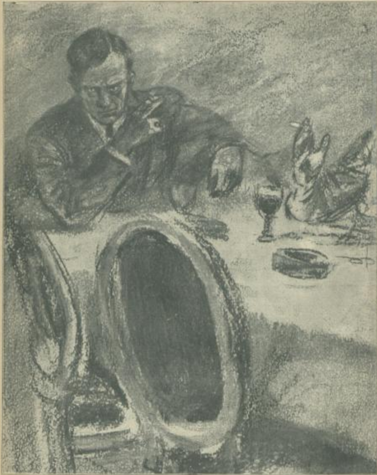
„ . . . Ich habe die Macht der Droge erprobt — und ich habe mich befreit —