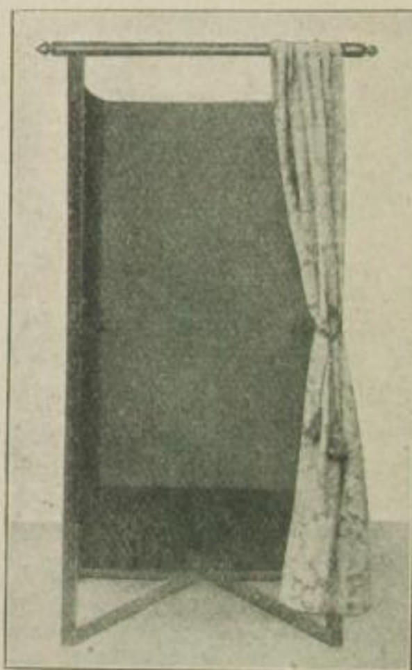
Das fertige Zelt mit der Rückwand und den Seitenwänden aus schwarzem Futterstoff.

zu den Zuschauern stehend, lassen Sie den einen Helfer sich direkt Ihnen gegenüber stellen und den andern hinter Sie, so daß Sie mit beiden in einer Reihe sind. Während Sie dann über das Experiment, das Sie jetzt vorführen wollen, ein paar Worte sprechen, fühlt der vor Ihnen Stehende plötzlich einen Schlag am Ohr. Sie wenden sich sofort Ihrem Hintermanne zu mit den Worten: „Bitte, lieber Freund, machen Sie keinen Unfug! Ich möchte doch den Trick ganz exakt ausführen...“, aber gleich darauf spürt der vor Ihnen Stehende wieder einen Schlag am Ohr. Das können Sie so oft wiederholen, wie Ihre Opfer stille halten, und wenn man Ihnen vorwirft, daß Sie selbst den Mann schlagen, so lassen Sie jemanden die Mütze lüften und zeigen ihm, daß Ihre Daumen noch fest zusammengebunden sind. Die Zuschauer, die Ihre Bewegungen beobachtet haben, wundern und amüsieren sich. Schließlich können Sie den Trick dahin variieren, daß Sie Schlingen über Ihre Arme werfen, während Ihre Daumen noch gefesselt sind, — oder Sie können einen Arm durch die Lehne eines Stuhls schieben, indessen die Daumen ge-