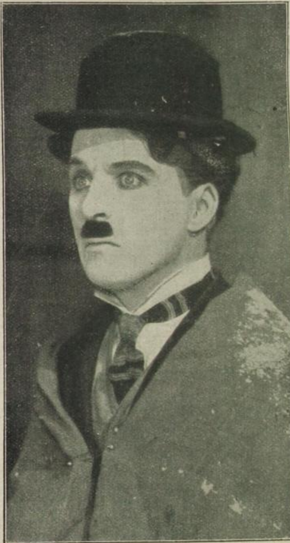
Charles Chaplin, der Filmkomiker, über den die Welt am meisten gelacht hat

Worüber lachen die Kinder in allen Ländern der Erde? Sie lachen über die Gebrechlichkeiten, körperlichen Fehler und Mißgeschicke der anderen Kinder, die sie sogar höh-nisch und hämisch nachahmen; sie lachen über Quäle-reien an Tieren und Menschen; sie lachen über Schie-lende, Bucklige, Hinkende; über Kleinere, denen sie ein Bein stellen; über nichtsnutzigen Unfug, mit dem sie die normale Ord-nung unter sich selbst oder den Er-wachsenen stören. Sie lachen also allesamt aus dem Gefühl der Über-legenheit gegen Schwächere, Be-