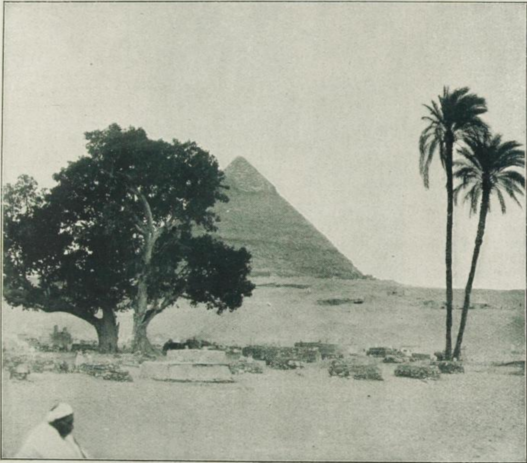
Uralter Friedhof am Fuße der Chephrenpyramide.