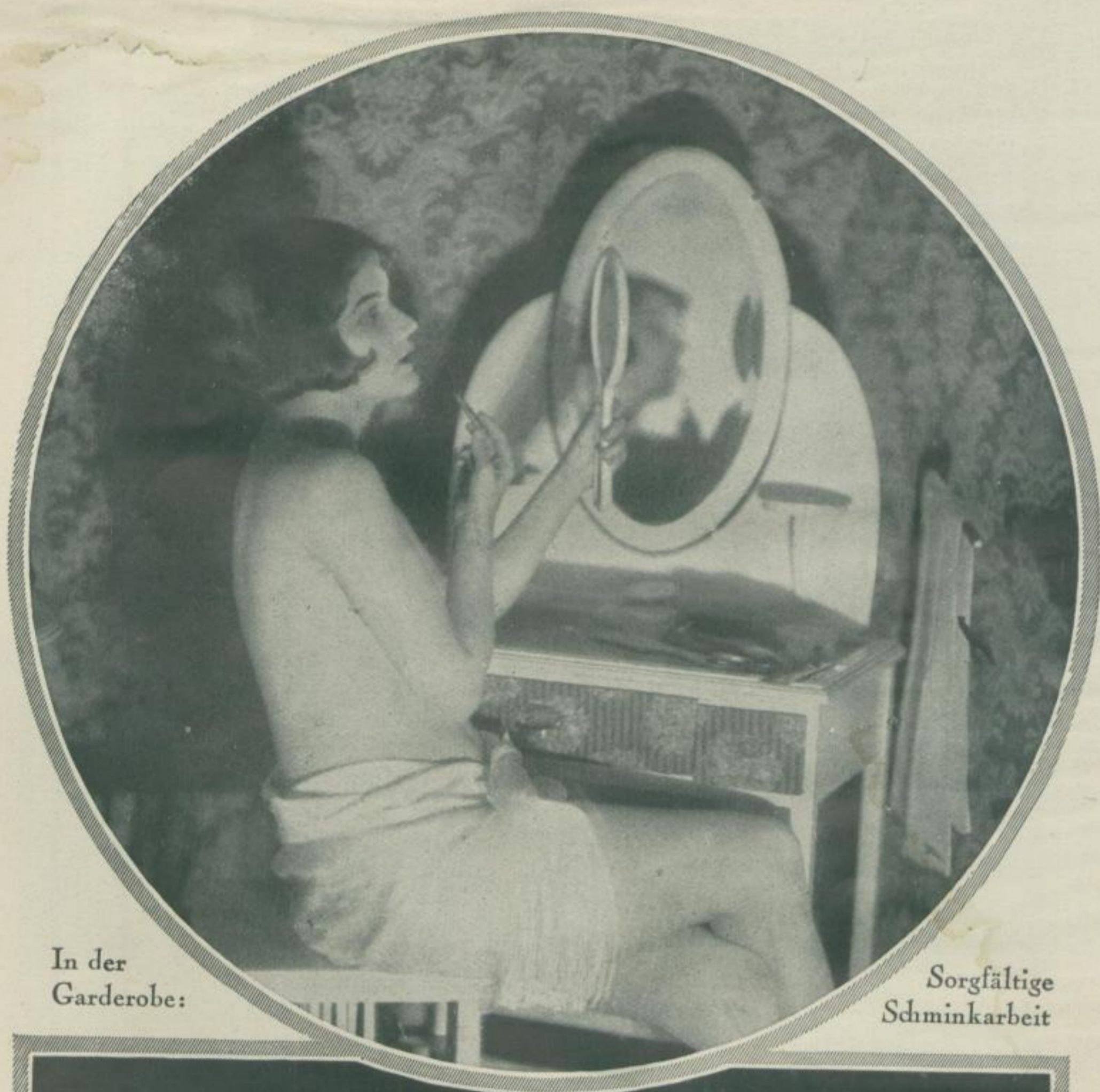
In der Garderobe: