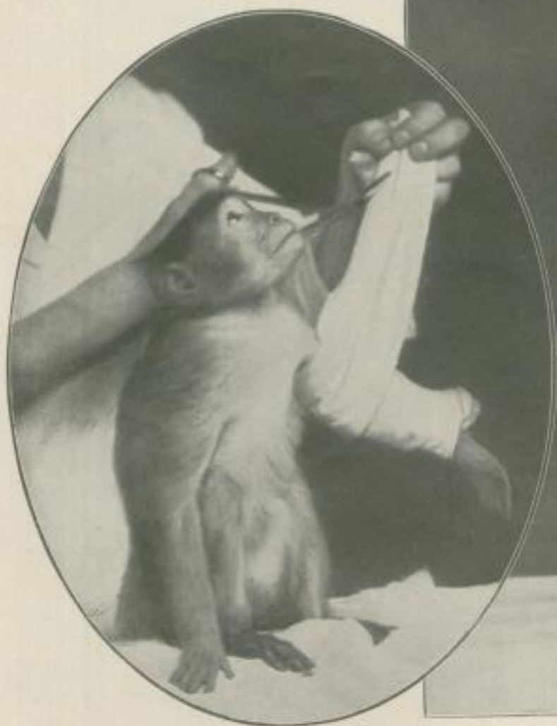
Momentaufnahmen aus dem Operationssaal: Joko wird sorgfältig wie ein kleines Kind verbunden. Die photographische Linse gibt deutlich das Vertrauen wieder, das Joko seinem Arzt entgegenbringt.

und der physiologischen Forschung — bedeutende Geister ihre Bannerträger gewesen sind. Einer der bekanntesten Gegner der Vivisektion war Richard Wagner. Wohl nur ein so großer Künstler konnte in einem Atem nordisches Heldentum verherrlichen — das doch wirklich nicht durch weichliches Mitleid glänzt, das sich der Zahl der erschlagenen Feinde rühmt und dessen Barden Raubzug und Mord als herr-