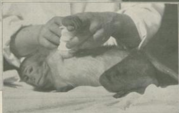
Aufnahmen für den 'Uhu' von A. Stöcker