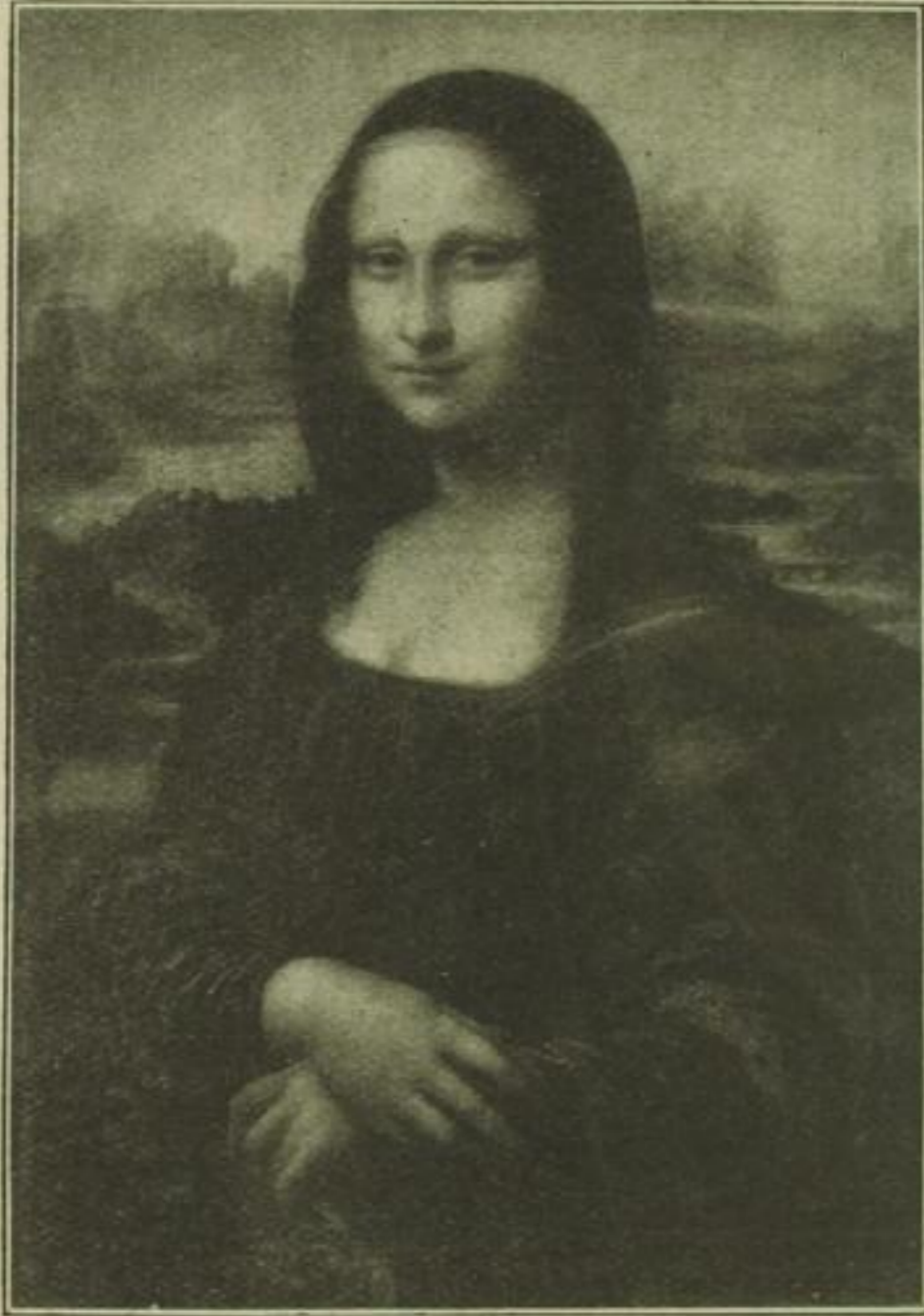
Neue Photographische Gesellschaft Leonardo da Vinci: Mona Lisa

spricht eine Form oder Farbe. Mache ich die heftige, aggressive Bewegung des Stechens und führe ich, anstatt, daß ich steche, den Zeichenstift auf dem Papier mit stechendem Charakter, dann wird die entstehende Form auf dem Papier genau die Empfindung des Stechens als Bewegungsform wiedergeben, und es wird eine scharfe Spitze ent-