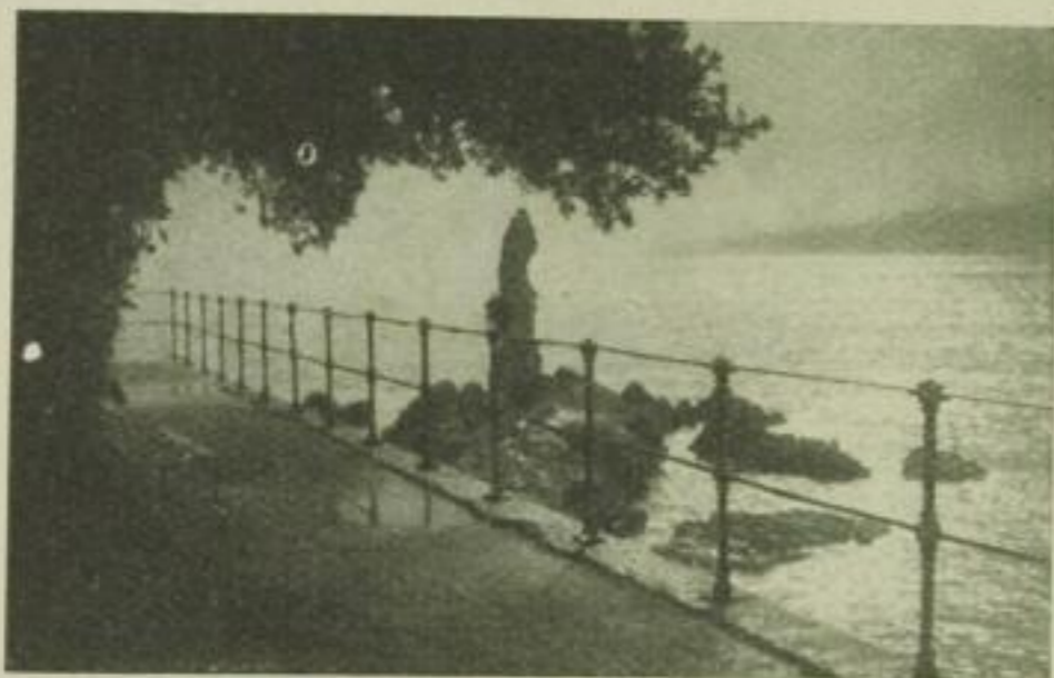
Klimatischer Kurort bei Fiume.

Von Deutschen bevorzugt. Deutschsprechendes Personal.