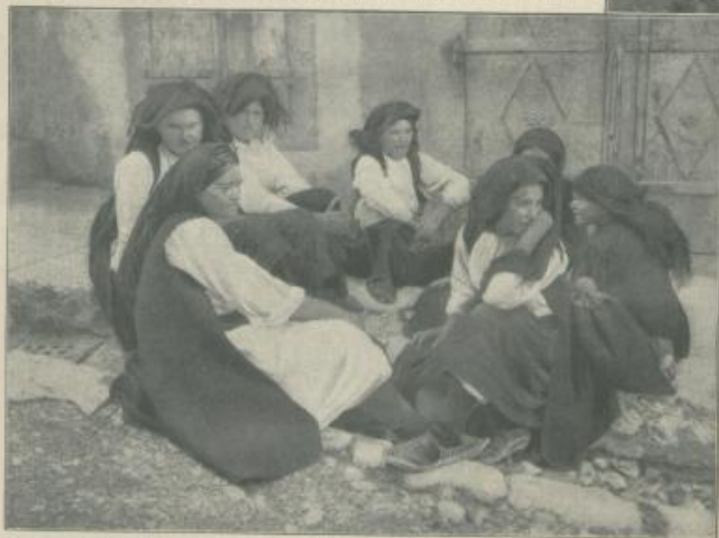
Bäuerinnen aus der Herzegowina

Tags vorher war ich in Trebinje zum Markt. Diese Stadt liegt