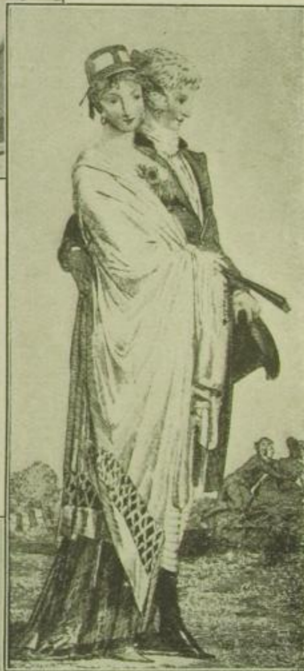
Übergang zur neuen Züchtigkeit: Der Schal deckt alles wieder zu.

intimsten Reize zur Schau zu stellen. In einem Frankfurter Modebericht aus dem Jahre 1797 heißt es: „In der Tat ist jetzt die Nuditäten-Mode bei manchen dieser Schönen des Tages so weit gediehen, daß sie von oben herab einem schönen Wilde gleichen und nach Abschaffung der Hemden ihnen schlechterdings nichts mehr fehlt als das elegante Tigerfell oder der leichte Federschurz um die Lenden, um das Kostüm